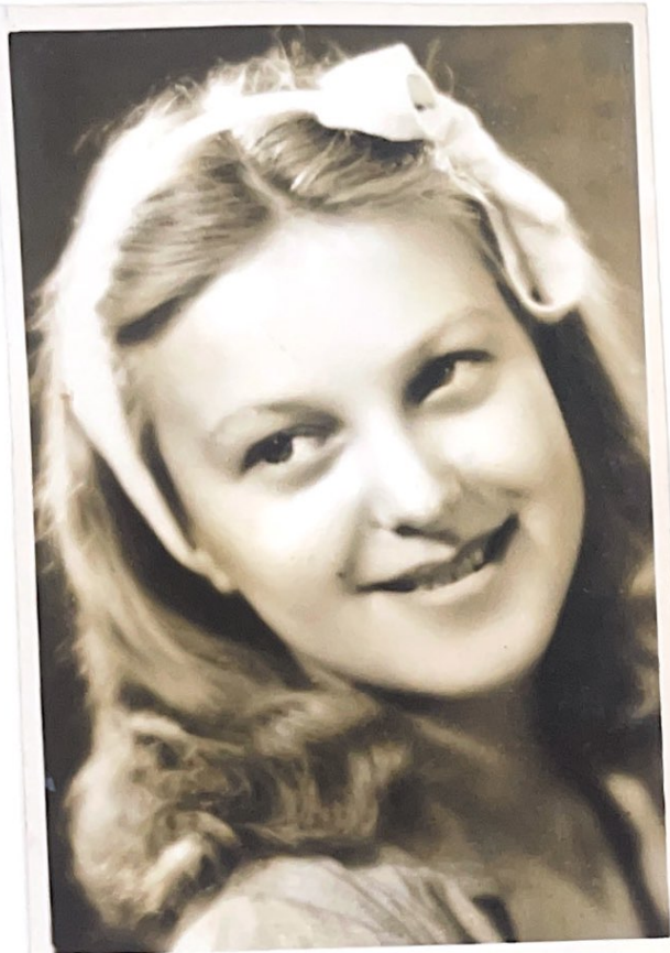
В и с ю ш к а 1 д е к а б р я 1945 г. г. Б р н о.