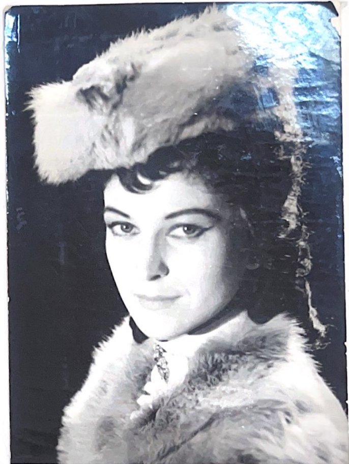
В и с я в р о з и А н н ы К а р е н н о й